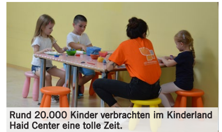
Rund 20.000 Kinder verbrachten im Kinderland Haid Center eine tolle Zeit.

Mehr als 100.000 Kinder und Erwachsene besuchten über 2.200 Veranstaltungen.