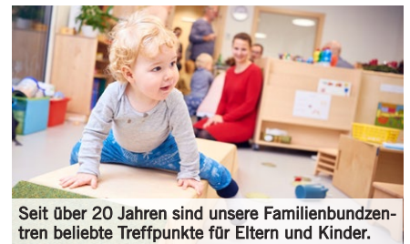
Seit über 20 Jahren sind unsere Familienbundzentren beliebte Treffpunkte für Eltern und Kinder.

Familienfeste Yoga und Pilates Eltern-Kind-Gruppen Kinderturnen Geburtsvorbereitung