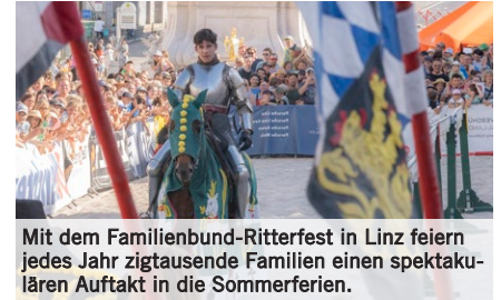
Mit dem Familienbund-Ritterfest in Linz feiern jedes Jahr zigtausende Familien einen spektakulären Auftakt in die Sommerferien.

Das Familienbund-Ritterfest zählt mit 40.000 Besucher*innen jährlich zum größten Besuchermagneten des OÖ Familienbundes. Im Jahr 2023 konnten die spektakulären Ritterturniere zu Pferde wieder am Linzer Hauptplatz ausgetragen werden. Eltern wie Kinder ließen sich vom mittelalterlichen Glanz sowie dem bunten Programm verzaubern und verbrachten einen erlebnisreichen Tag in Linz. Wie auch die anderen Großevents, ist das Familienbund-Ritterfest mit dem Gütesiegel „Green Event“ des Landes Oberösterreich ausgezeichnet.