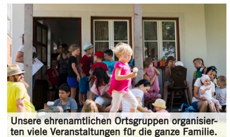
Unsere ehrenamtlichen Ortsgruppen organisieren viele Veranstaltungen für die ganze Familie.

Schwangerschaftsyoga Ausflüge Schwimmkurse Loslass-Gruppen